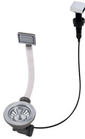
自动下水 - PM 8407 113