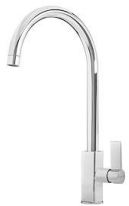
龙头 Delta 8441 000