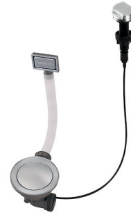
自动下水器 Space - PE 8407 109